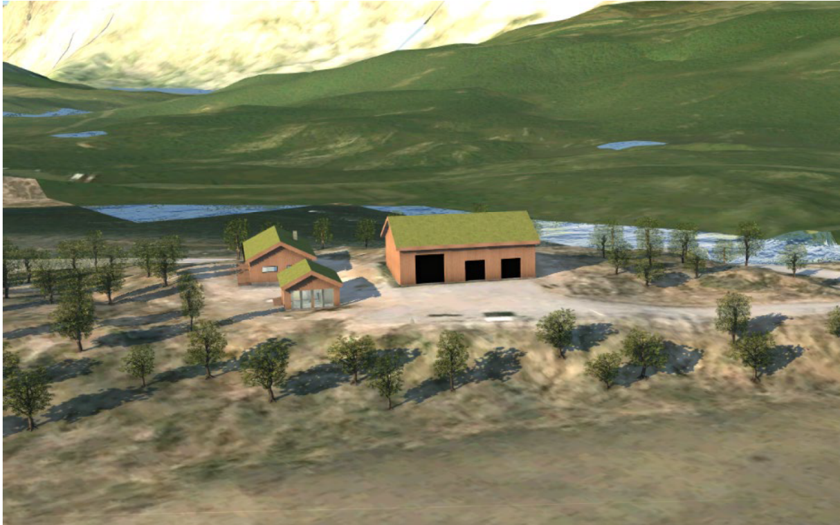
Figur 3: 3D-illustrasjon av tiltaket sett frå søraust. Illustrasjonen er henta frå Nordplan sin søknad om planendring. Søkna den viser fleire illustrasjonar av planlagt tiltak.

I planprosessen som førte fram til plangodkjenning i 2018 var det lagt vekt på omsynet til landskap og omgjevnader samt natur og friluftsliv. Tenestebustadeininga vil ha mønehøgde på 4,5 m og vil påverke landskapet mindre enn ei auke i BYA for dagens garasjebygg, som gjeldande plan opnar for. Ny tenestebustadeining skal jf. planføresegnene ha ei utforming som harmonerer med bygg allereie oppført i området. Fylkeskommunen sine kommentarar vil takast i vare gjennom føresegnene i planen. Byggelinjer for nytt bygg er innlagt i plankartet, og tiltaket ligg utanfor aktsemdområde for flom. Planen er oppdatert m.o.t. omsynssone for flaumfare. Kommunen har vore i kontakt med NVE om dette, og NVE gav i brev attendemelding til kommunen i forkant av kommunen si utsending av saka. Plan- og bygningslova sine krav til tilstrekkeleg tryggleik etter TEK17 er teke i vare i framlagt mindre planendring.