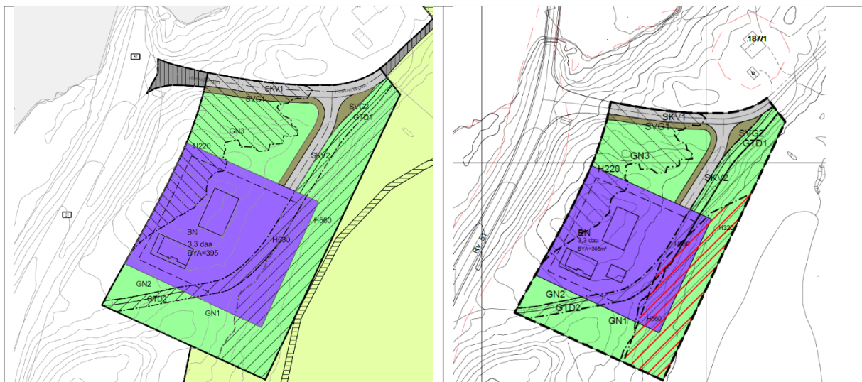
Figur 1: Til venstre; utsnitt av gjeldande plansituasjon i området. Til høgre; plankart for framlagt reguleringsendring for planen Maurvangen vest for Mola..

Tiltaket medfører ikkje endring i tilkomst til planområdet eller andre endringar i planens rammer for utbygging. Søknaden inneber ikkje auke i samla maksimal utnyttingsgrad, som framleis er avgrensa til 395 m 2 . Dette inneber at ved oppføring av ny tenestebustadeining, vil samtidig handlingsrommet for utviding av garasjebygget bli tilsvarande mindre.