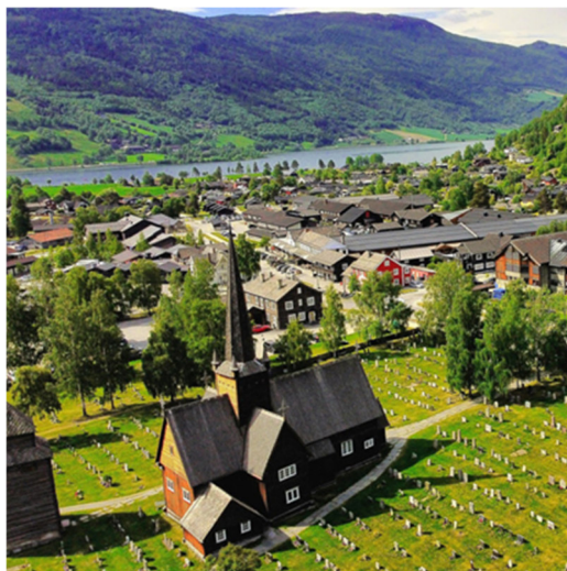
Figur 3- Kyrkja i Vågå

Den som vel å flytte til Vågå, og bu i Vågå, skal kjenne seg trygg på at det er ein god stad å bu gjennom alle fasar i livet. Å bu i Vågå, og å flytte til Vågå, handlar om eit livsstilsval. Vågå ønskjer å vere synleg i ulike samanhengar og kanskje på litt utradisjonelle arenaer. Den kommunale tilflyttartenesta er viktig for å hjelpe nye innbyggjarar til rette i bygda.