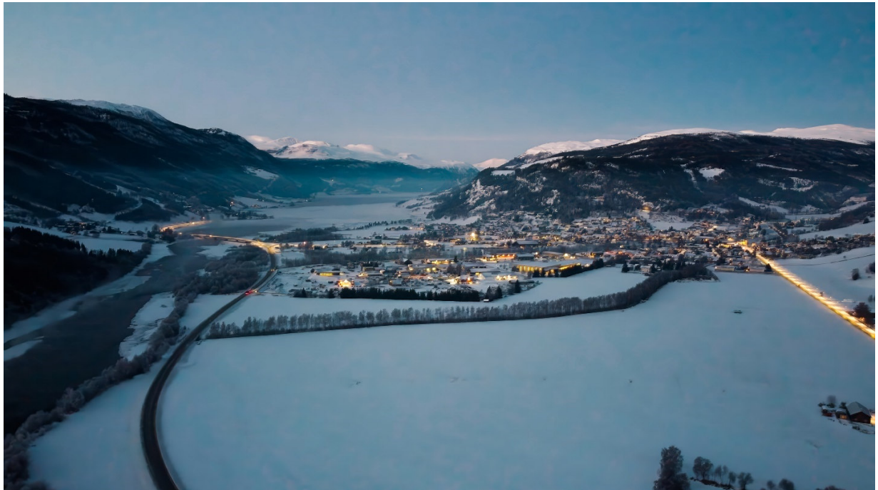
Figur 5 – Vågåmo vinterstid

Da kommuneplanens samfunnsdel 2017-2027 vart vedteke i 2017 var det lagt ned eit omfattande planarbeid og planen var som ny å rekne. Revideringa no blir mykje meir avgrensa og det einaste hovudfokusområdet som er nytt er ei formalisering frå nyleg vedteke kommunedelplan for klima, energi og miljø 2024-2031. Det er likevel viktig med medverknad frå administrasjon, politikken, kommunale råd og gjennom brukar- og interessegrupper. Utarbeiding av planforslag skjer elles i dialog med overordna styresmakter.