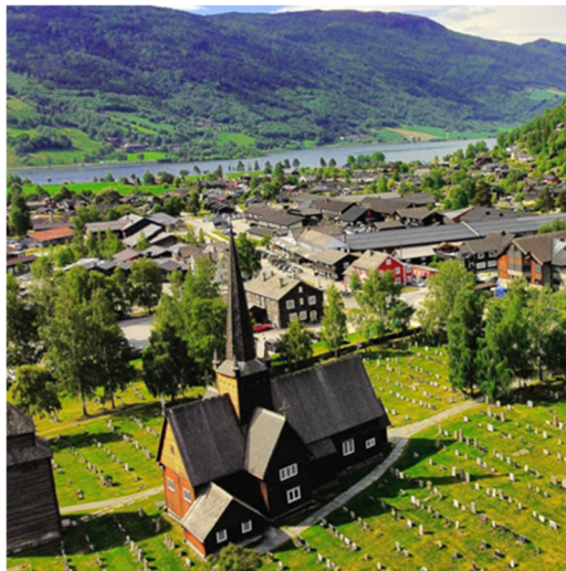
Figur 3- Kyrkja i Vågå

Den som vel å flytte til Vågå, og bu i Vågå, skal kjenne seg trygg på at det er ein god stad å bu gjennom alle fasar i livet. Å bu i Vågå, og å flytte til Vågå, handlar om eit livsstilsval. Vågå ønskjer å vere synleg i ulike samanhengar og kanskje på litt utradisjonelle arenaer. Den kommunale tilflyttartenesta er viktig for å hjelpe nye innbyggjarar til rette i bygda.