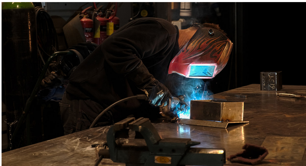
Figur 4 - Næringsverksemd i Vågå