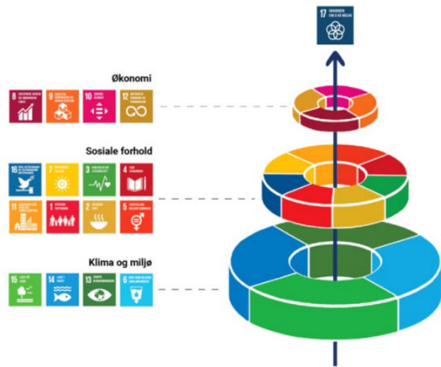
Figur 1: FNs 17 berekraftsmål kan delast inn i tre dimensjonar: klima og miljø, sosiale forhold og økonomi.

Eit viktig prinsipp er at ingen skal utelatast. FNs 17 berekraftsmål har tre dimensjonar som er klima- og miljø, sosiale forhold og økonomi. Parisavtalen om klima og naturavtale er sentrale for å nå berekraftsmåla og er forpliktande for kommunane.