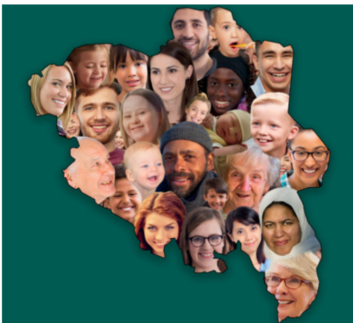
Figur 1 – Innlandsstrategien – Illustrasjon frå Innlandet Fylkeskommune

For perioden 2024-2028 er det signalisert behov for ny samferdselsstrategi for innlandet som mellom anna skal danne grunnlag for samspell med staten sitt arbeid med Nasjonal transportplan. Mobilitetsstrategi for Innlandet 2021-2030 skal reviderast i 2024/2025 og Handlingsprogram for fylkeskommunen sin kollektivtransport, vedteke i 2020, er forutsett lagt til grunn for dette arbeidet.